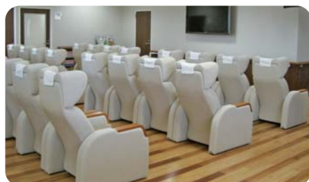
人間ドック専用待合室

ISO9001 認証取得・ISO27001 認証取得 日本総合健診医学会優良総合健診施設