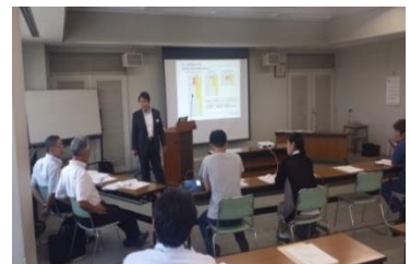
実習（ワーク）イメージ

○問合せ 金沢商工会議所 会員サービスグループ TEL：076-263-1152